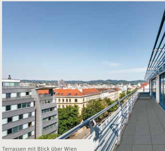
Terrassen mit Blick über Wien