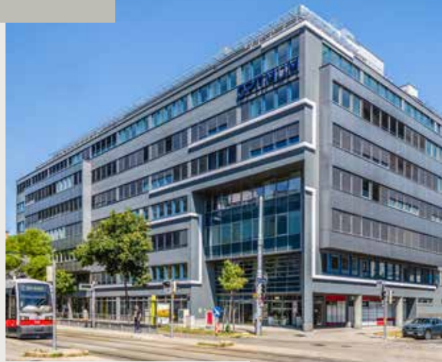
Dresdner Straße / Traisengasse

Derzeit sind Einheiten zwischen 400 m 2 und 1.500 m 2 verfügbar. Durch das großzügige Ausbauraster können die Flächen sowohl zu Einzel- als auch Gruppenbüros geteilt oder völlig offen gestaltet werden.