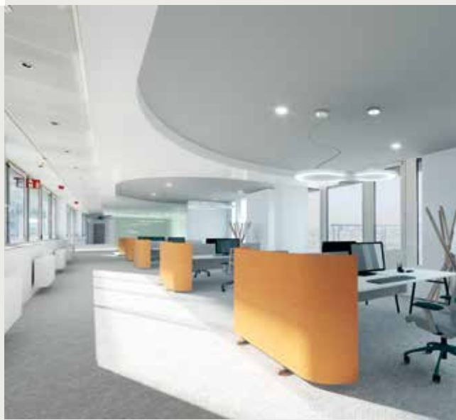
Individuelle Planung durch flexibles Ausbauraster