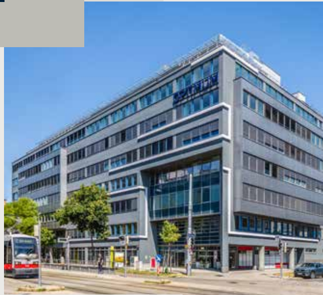
Dresdner Straße / Traisengasse

Derzeit sind Einheiten zwischen 400 m 2 und 1.500 m 2 verfügbar. Durch das großzügige Ausbauraster können die Flächen sowohl zu Einzel- als auch Gruppenbüros geteilt oder völlig offen gestaltet werden.