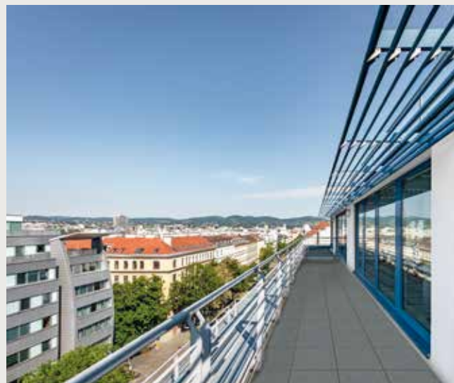
Terrassen mit Blick über Wien