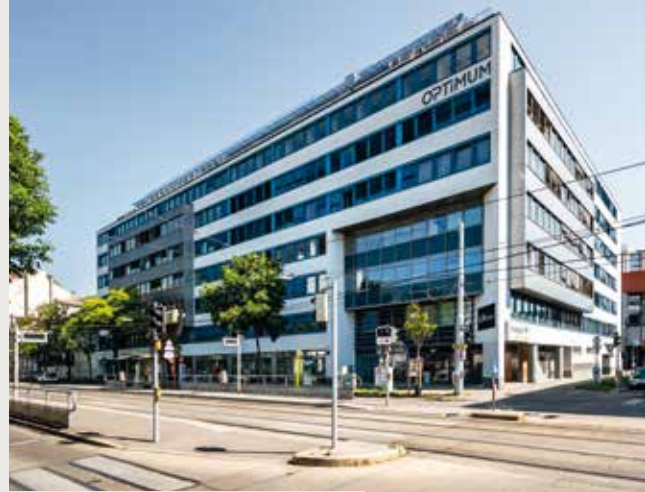
Dresdner Straße / Traisengasse

Derzeit sind Einheiten zwischen 399 m 2 und 1.500 m 2 verfügbar. Durch das großzügige Ausbauraster können die Flächen sowohl zu Einzel- als auch Gruppenbüros geteilt oder völlig offen gestaltet werden.